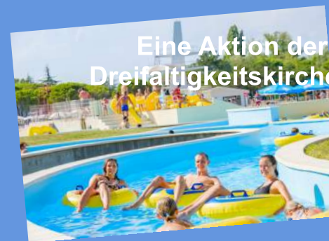
Eine Aktion der Evang. Jugend der Dreifaltigkeitskirche Augsburg-Göggingen